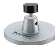
52110162 Ripiano per docking station n. 7762