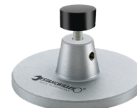
52110162 Wsparcie dla stacji dokującej nr 7762