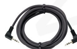
52110051 Cables de clavija