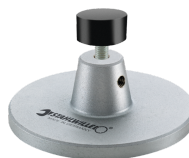
52110162 Édition pour station d'accueil réf. 7762