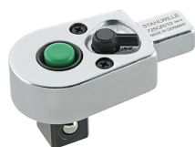
58253004 Cliquet à emboîtement QR