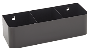
90432727 Support pour bombes aérosol