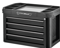
81200157 Coffre à outils