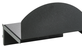
89010040 Support de câbles