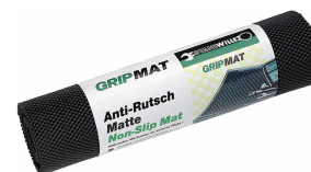
89010003 Tapis antidérapant GRIPMAT