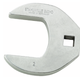
02501036 Crowfoot-Schlüssel heavy-duty