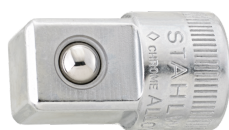
11030003 Douille à choc