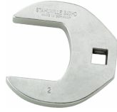
02501050 Crowfoot-Schlüssel heavy-duty