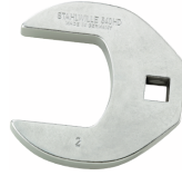
02501052 Crowfoot-Schlüssel heavy-duty