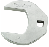
02501048 Crowfoot-Schlüssel heavy-duty