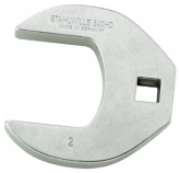
02501056 Crowfoot-Schlüssel heavy-duty