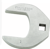
02501036 Crowfoot-Schlüssel heavy-duty