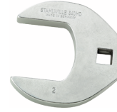
02501054 Crowfoot-Schlüssel heavy-duty