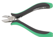
67076000 Tronchese a taglio obliquo per l'elettronica