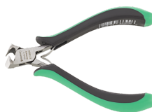
67106000 Tronchese a taglio obliquo per l'elettronica