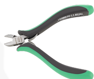
67086000 Mini tronchese a taglio obliquo per l'elettronica