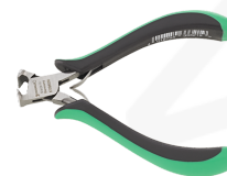
67096000 Tronchese a taglio a frontale per l'elettronica