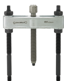
71050101 Dispositivo di estrazione