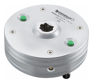
96524020 Laboratoryjny przetwornik