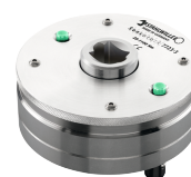
96521028 Przetwornik momentu obrotowego