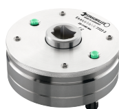
96522023 Przetwornik momentu obrotowego