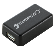
52110061 Adapter interfejsu