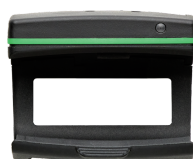
52110220 Bluetooth Low Energy modul 714