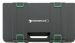
81271019 Cassetta assortimento