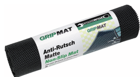
89010003 Mata antypoślizgowa GRIPMAT