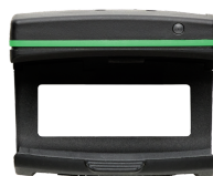
52110220 Bluetoothmodule für Drehmomentschlüssel