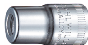
12180030 Uchwyt do bitów