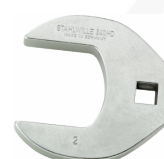
02501042 Klucz CROW-FOOT heavy-duty