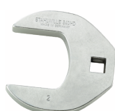
02501040 Klucz CROW-FOOT heavy-duty