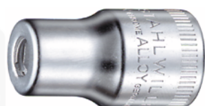
12180026 Uchwyt do bitów