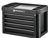
81200157 Skrzynka narzędziowa