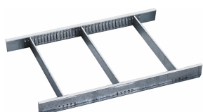
81484001 Podział szuflad