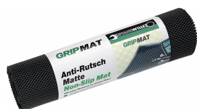
89010003 Mata antypoślizgowa GRIPMAT