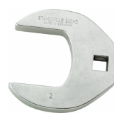
03501069 Llaves de carga pesada CROW-FOOT