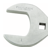
03501069 Kraaiensoortleutel heavy-duty