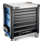
81200170 Cassettiera mobile antiribaltamento MAXI