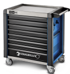
81200173 Cassettiera mobile antiribaltamento MAXI