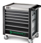
81200169 Cassettiera mobile antiribaltamento MAXI