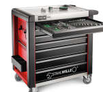
81200171 Cassettiera mobile antiribaltamento MAXI