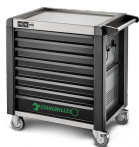
81200172 Cassettiera mobile antiribaltamento MAXI