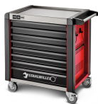
81200174 Cassettiera mobile antiribaltamento MAXI