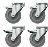
89480003 Set di ruote con regolazione della direzione