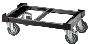
81200158 Trolley per Cassetiera Convertibile