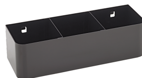
90432727 Portabombolette spray