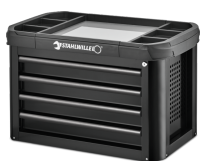
81200157 Cassetiera Convertibile