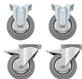
81490005 Set di ruote