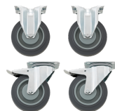
81490001 Set di ruote