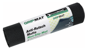
89010003 Tappeto antiscivolo GRIPMAT