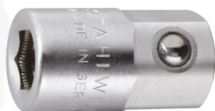
11180020 Uchwyt do bitów