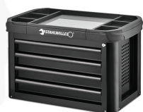
81200157 Skrzynka narzędziowa