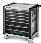
81200169 Carro de taller