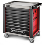
81200174 Carro de taller