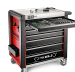
81200171 Carro de taller