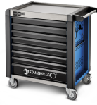
81200173 Carro de taller