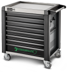
81200172 Carro de taller