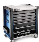
81200170 Carro de taller