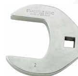
03501072 Kraaienpootsleutel heavy-duty