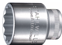
03010027 Wkładka do kluczy nasadowych