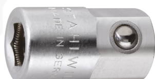
11180020 Uchwyt do bitów