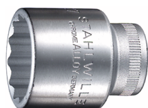
03010027 Wkładka do kluczy nasadowych