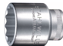
03010019 Wkładka do kluczy nasadowych