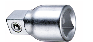
13010001 Rallonge pour clé à douille