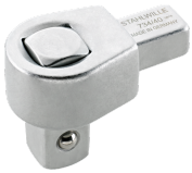
58240020 Vierkant- Einsteckwerkzeug