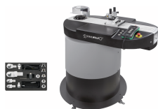
96521094 Automatisk kalibrerings- og justeringsanordning fra 1-400 N·m