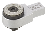
58250004 Carraca de inserción de dientes finos