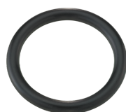
39011940 Anelli in gomma