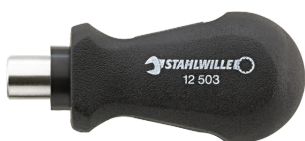
18110016 Uchwyt do bitów