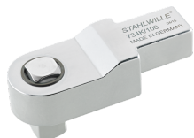
58243005 Herramienta inserción cuadrangular de calibración