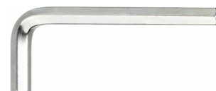
43150002 Sekskantet vinkelskruetrækker