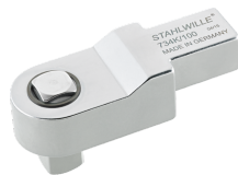
58243020 Końcówka wtykowa czworokątna do kalibracji