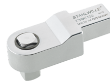
58243004 Końcówka wtykowa czworokątna do kalibracji