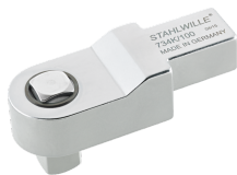
58243005 Końcówka wtykowa czworokątna do kalibracji