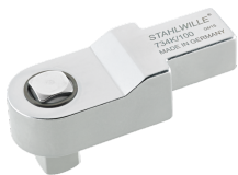
58243040 Końcówka wtykowa czworokątna do kalibracji