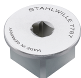
58521087 Adapter czworokątny