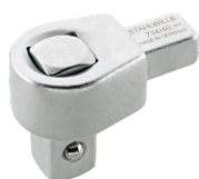
58240020 Attacco quadro a innesto