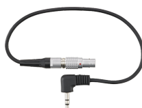
52110058 Cable Lemo con conector de clavija