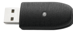
52111057 Adaptador USB