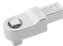
58243004 Attacco quadro a innesto di calibrazione