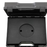
81500003 Cassetta in plastica, vuota