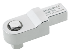
58243005 Herramienta inserción cuadrangular de calibración