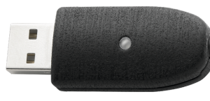
52111057 Adaptador USB