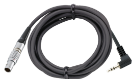
52110054 Cable para n° 7728