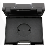
81500004 Cajas de plástico, vacías