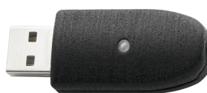
52111057 Adapter USB