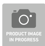
83585224 Wkładka z twardej pianki do skrzynki z narzędziami