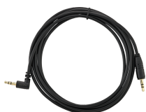
52110052 Cavo a spirale