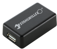
52110061 Adattatore di interfaccia