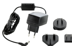
52110056 Fuente de alimentación