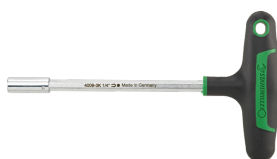
18093016 Uchwyt do bitów