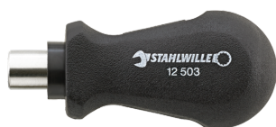
18110016 Uchwyt do bitów