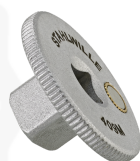
11030010 Douille à choc